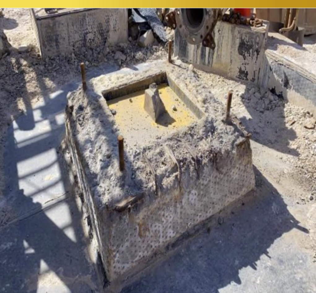
Imagen 21. Demolición de dados de fundación, Dump Este