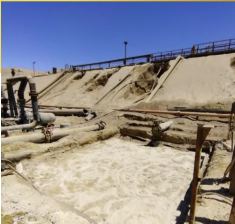
Imagen 15. Mejoramiento de Suelo Bomba 70/70B, Dump Oeste.