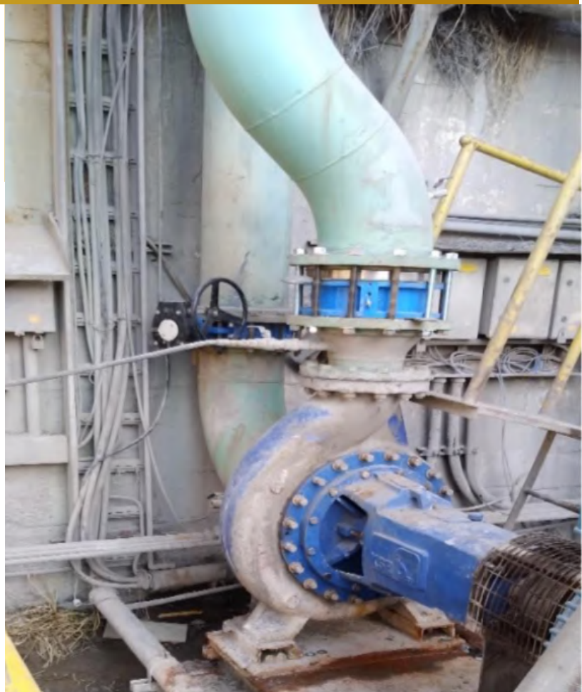
Imagen 2, Montaje de Válvula de paso.

Sargento Aldea, lote B2, n°580, Nogales.