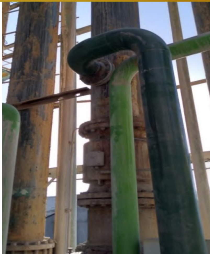
Imagen 4, Instalación Piping 8" Bombas KSB

Sargento Aldea, lote B2, n°580, Nogales. Teléfono: 56 9 9326 6649 – 56 9 9050 3772 leonardoguerrah@hotmail.com – lghservicios@hotmail.es