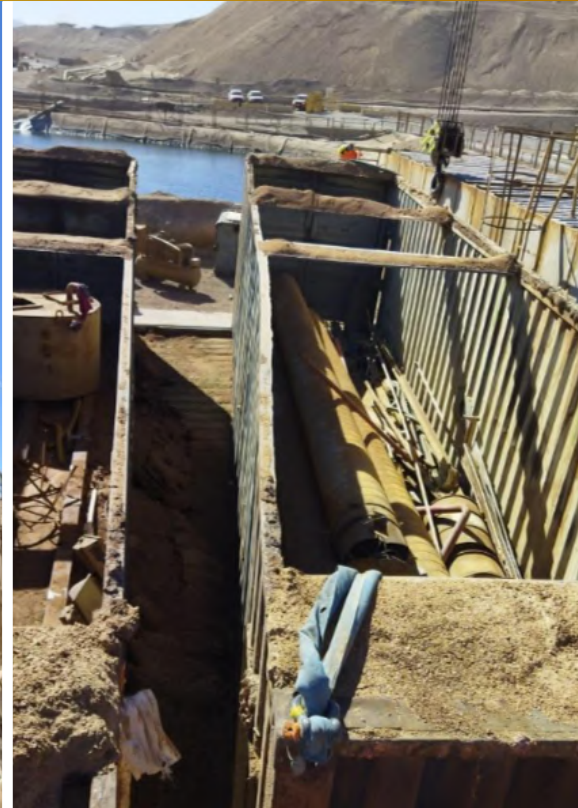
Imagen 20. Desarme Planta Bio masa.

Sargento Aldea, lote B2, n°580, Nogales. Teléfono: 56 9 9326 6649 – 56 9 9050 3772 leonardoguerrah@hotmail.com – lghservicios@hotmail.es