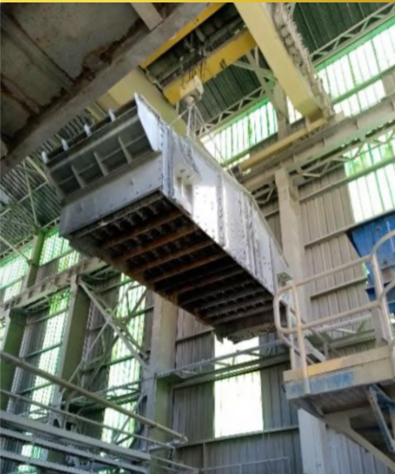
Imagen 9. Retiro de Harnero SAG.