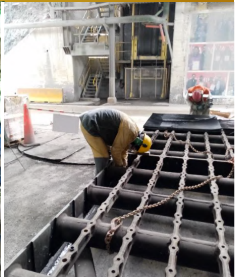
Imagen 10. Reparación de Harnero SAG.

Sargento Aldea, lote B2, n°580, Nogales.