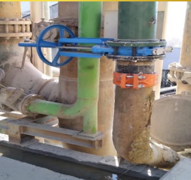
Imagen 3, Montaje de Válvula de paso. Bombas KSB