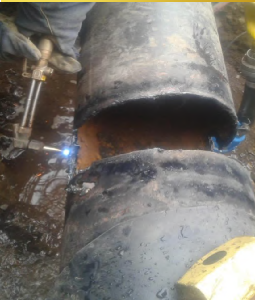
Imagen 7, Corte de Cañería 10" para instalación de flujómetro en bombas melón.