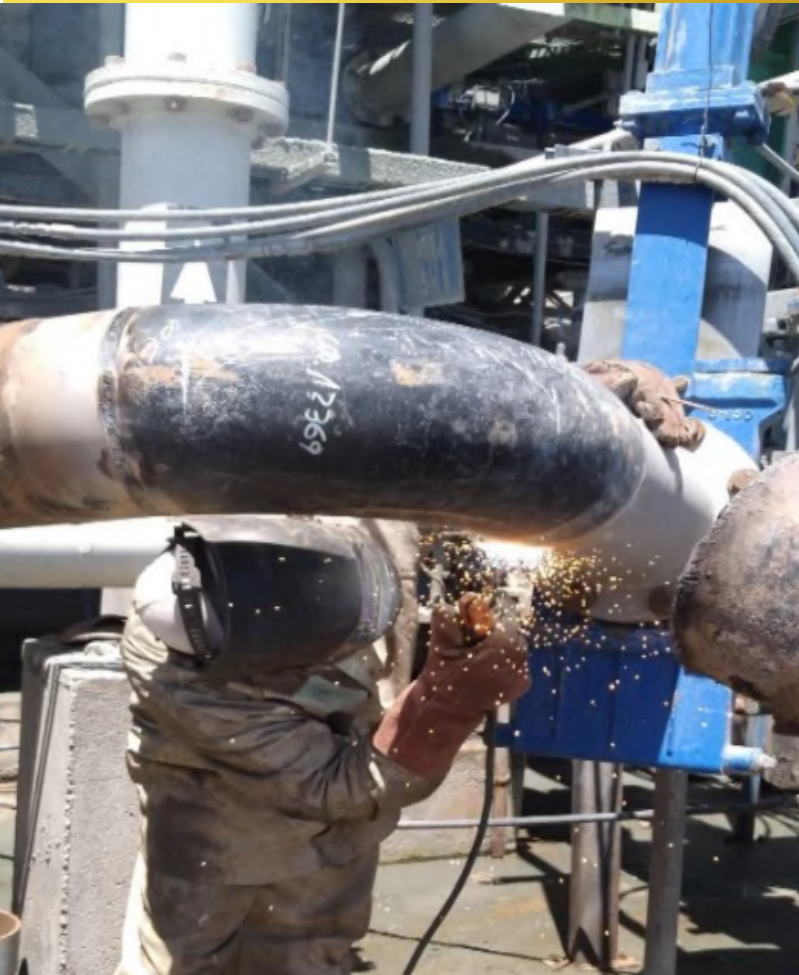
Imagen 13, Confección e Instalación Piping 8” Relave, Tranque el Torito