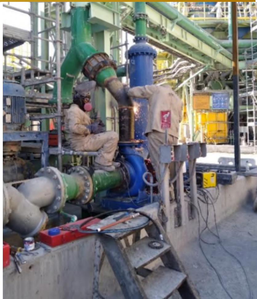
Imagen 5, Construcción Mesa de Soportación Bomba CPF PP12.

Sargento Aldea, lote B2, n°580, Nogales.