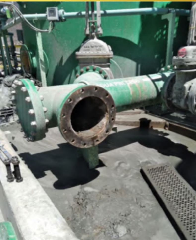
Imagen 5, Construcción Mesa de Soportación Bomba CPF PP12.