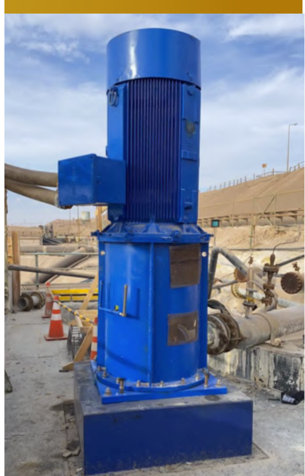
Imagen 22. Montaje de Bomba y Motor Vertical, Dump Este

Sargento Aldea, lote B2, n°580, Nogales.