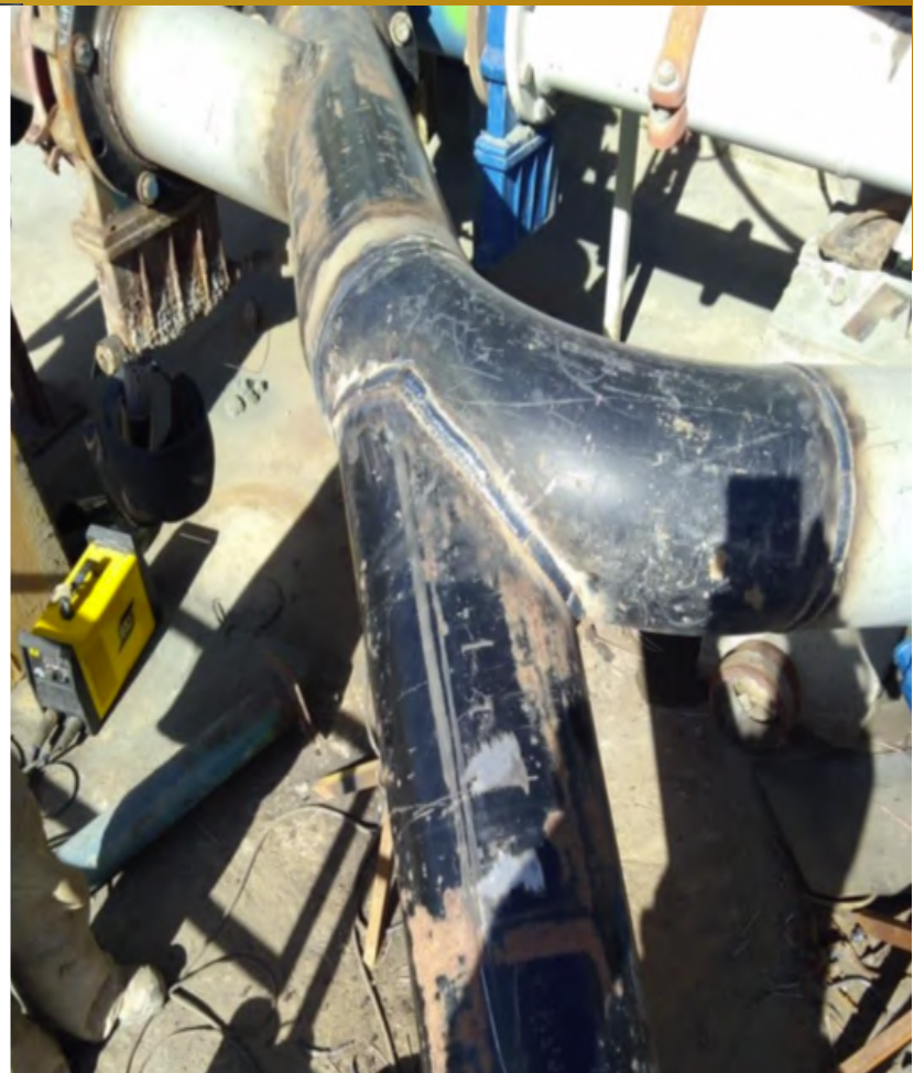
Imagen 14, Confección e Instalación Piping 8” Relave, Tranque el Torito

Sargento Aldea, lote B2, n°580, Nogales.