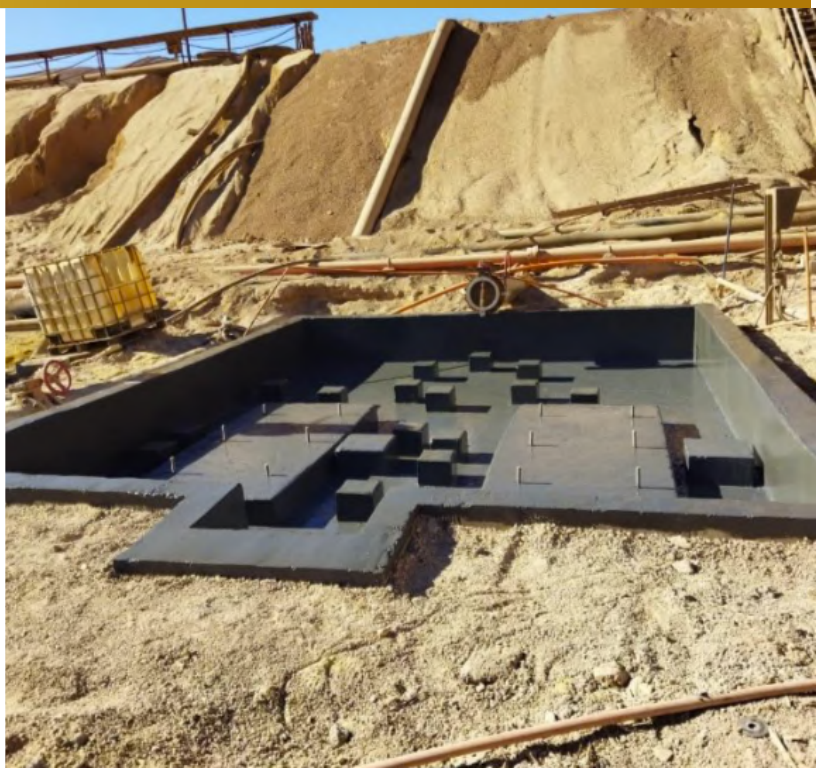
Imagen 16. Hormigonado finalizado Bomba 70/70B, Dump Oeste.

Sargento Aldea, lote B2, n°580, Nogales.