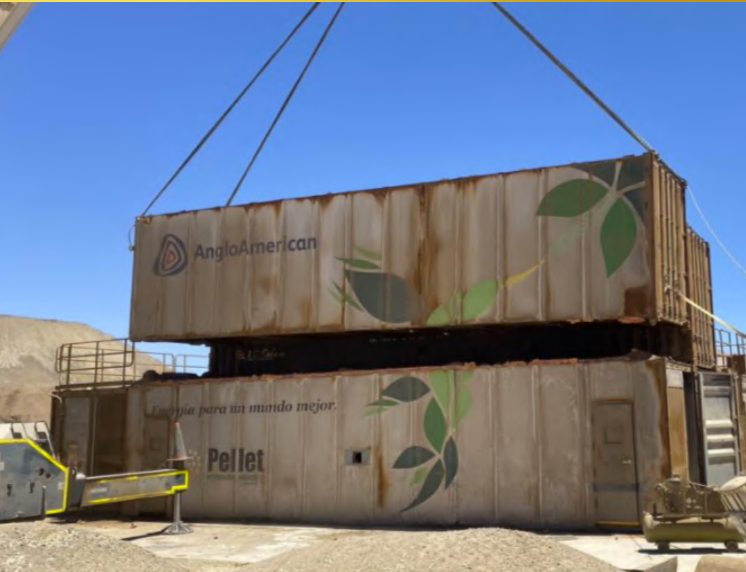
Imagen 19. Izaje de contenedores Planta Bio masa.