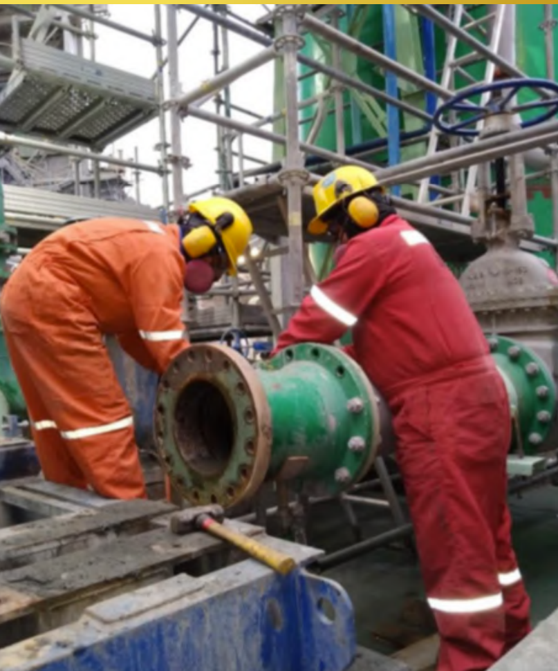
Imagen 11. Instalación Piping confeccionado Planta CPF