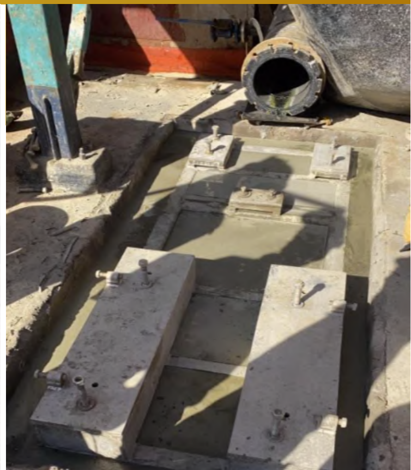
Imagen 18. Montaje de Frame Bomba 110 Refino..

Sargento Aldea, lote B2, n°580, Nogales.