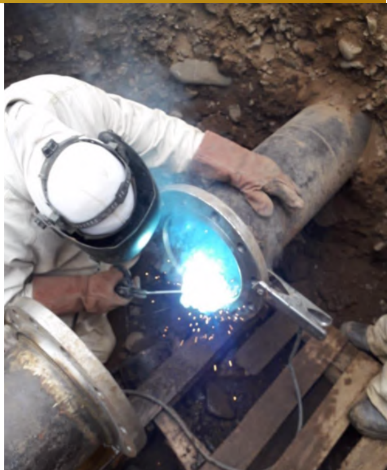
Imagen 8, Soldadura de Flanges para instalación de flujómetro en bombas melón

Sargento Aldea, lote B2, n°580, Nogales.