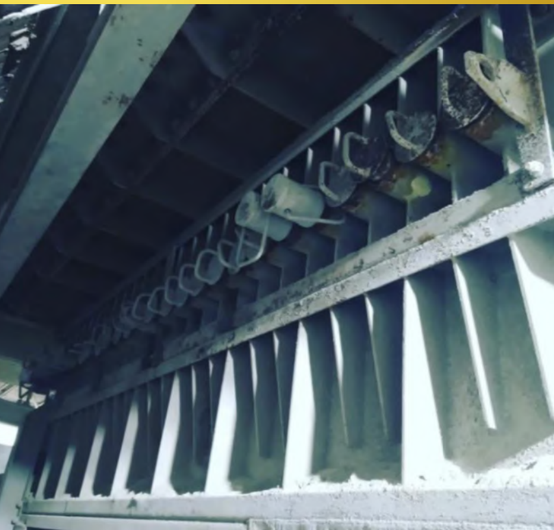
Imagen 1, Reposición de Misiles Alimentador.