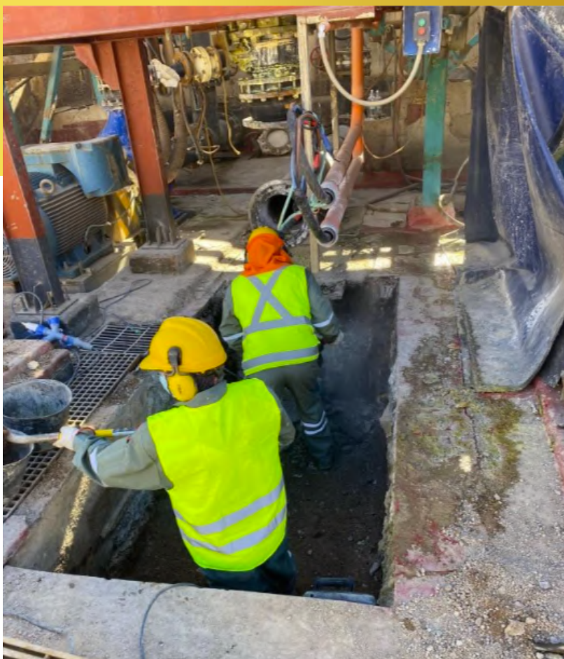
Imagen 17. Excavación Fundación Bomba 110 Refino.